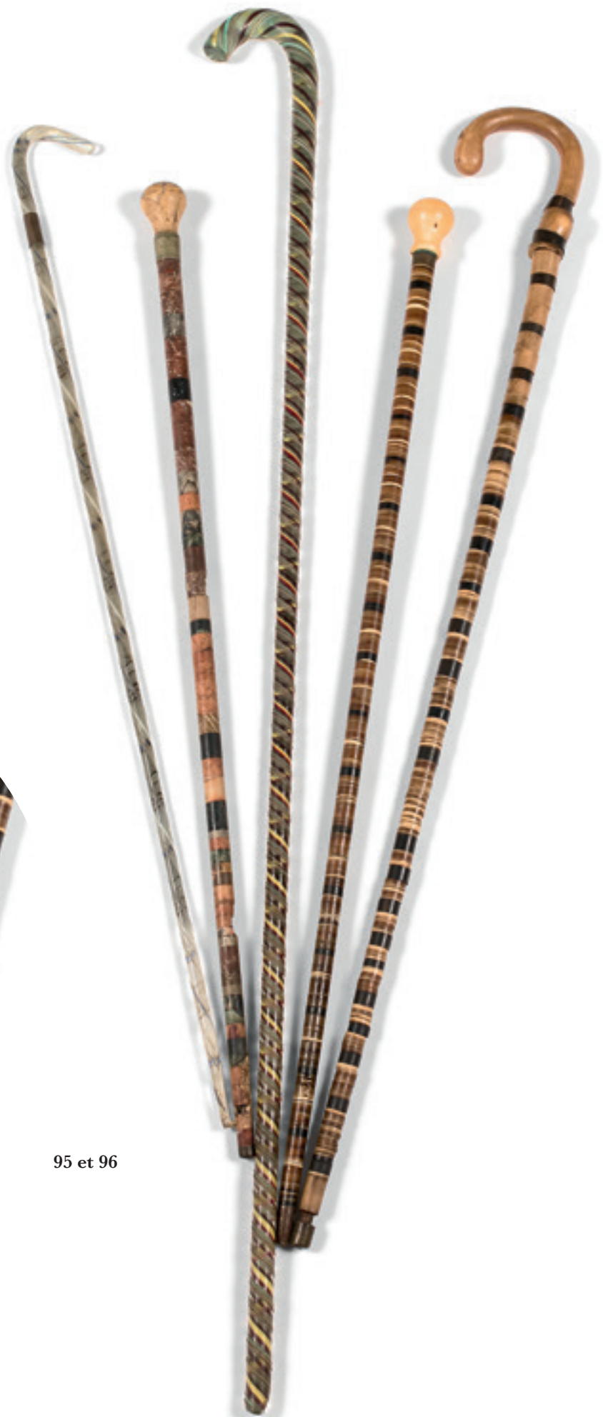
95 et 96