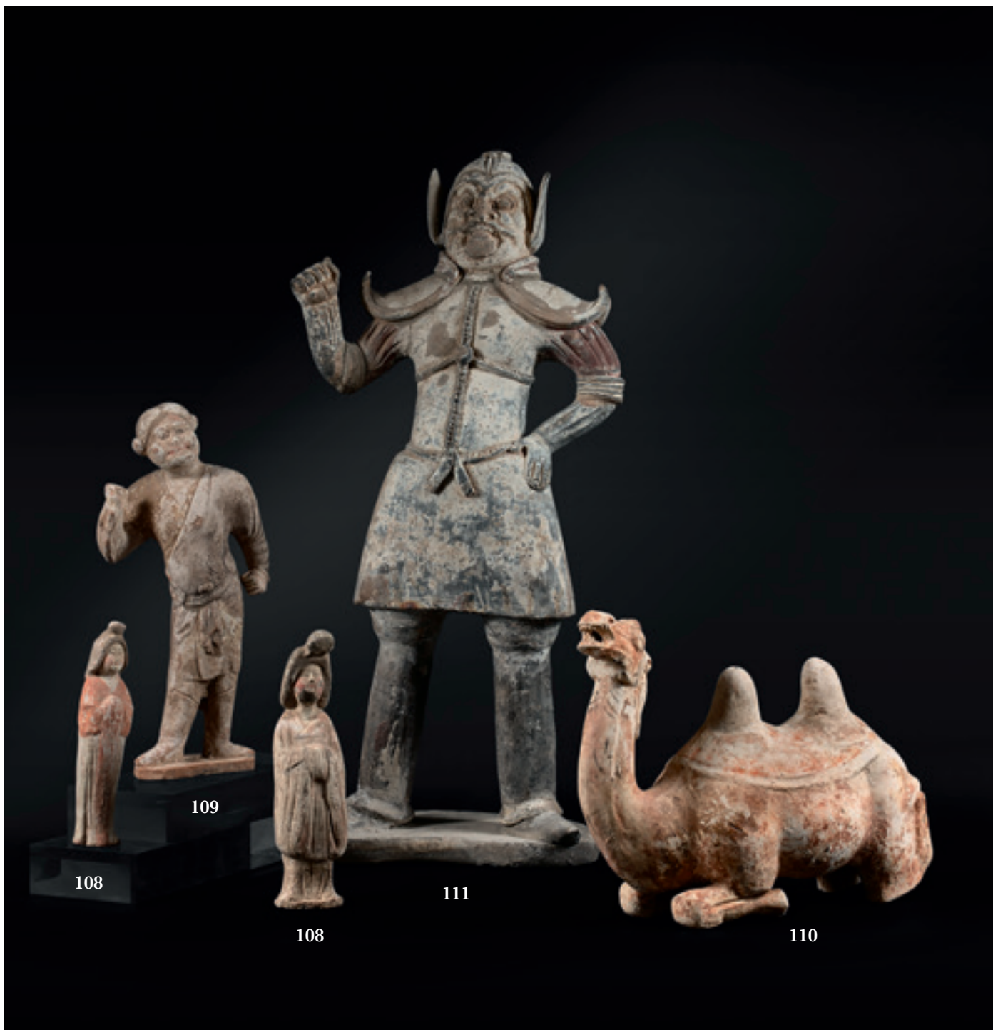
108 Deux statuettes représentant des petites fat ladies debout, en terre cuite à traces de polychromie noire et engobe blanc. Chine, dynastie des Tang, 618-907. Hauteurs : 22 et 18,5 cm 300 / 400 €